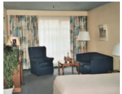
Clarion Hotel Grand Olav, Trondheim

Weitere Hotels in Arendal, Bodø, Drammen, Fagners, Førde, Gjøvik, Holmsbu, Hønefoss, Kongsberg, Kragerø, Langesund, Mo i Rana, Molde, Norefjell, Oppdal, Sandnes, Sarpsborg, Skien, Sogndal, Steinkjer und Tønsberg. Preise auf Anfrage. Zusatzbett ab Fr. 51.-.