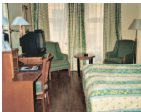
Thon Hotel, Bergen

Weitere Hotels: Dombås, Fredrikstad, Førde, Gol, Hamar, Kristiansund, Levanger, Mo i Rana, Morgedal, Nordfjordeid, Nusfjord, Sandefjord, Sandessjøen, Svalbard, Ulvik und Vadsø. Preise auf Anfrage.