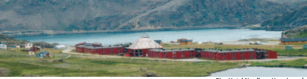
Rica Hotel Nordkap, Honningsvåg